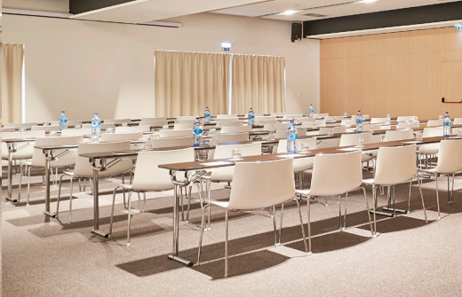
Sala Ceuta 2