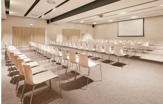
Sala Ceuta 1