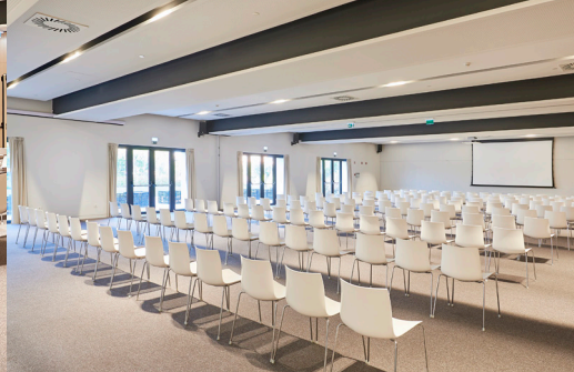
Sala Ceuta 1+2